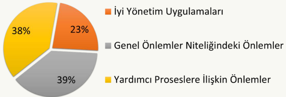
Su Verimliliği Uygulamalarının Yüzdelerle Dağılımı