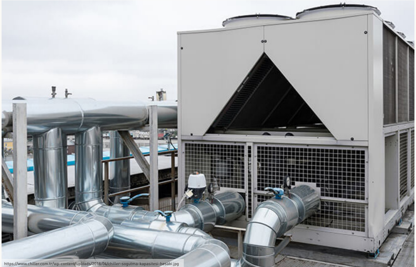
Soğutma Sistemleri (Chiller)

Su, imalat sanayinin üretim proseslerinde ve ürünlerin soğutulması gibi birçok processte soğutucu akışkan olarak kullanılmaktadır. Su, soğutma kulesi veya merkezi soğutma sistemleri aracılığı ile resirküle edilerek soğutma işlemi gerçekleştirilmektedir. Eğer soğutma suyunda istenmeyen mikrobiyal bir büyüme gerçekleşir ise resirkülasyon suyuna kimyasal ilavesi yapılarak kontrol altına alınabilmektedir (TUBİTAK MAM, 2016). Resirkülasyon işleminde kimyasal şartlandırmanın iyi yapılmasıyla döngü sayısı artırılabilir. Bu şekilde sisteme beslenen taze su miktarı azaltılarak su tasarrufu sağlanabilir. Ayrıca soğutma tamamlama suyunun iyi şartlandırılması da döngü sayısını artırılabilmektedir (TOB, 2021).